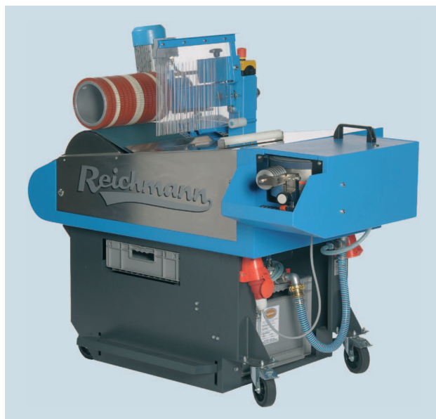
Affûtage latéral et entraîneur en options.