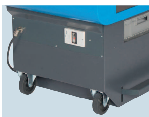
Roulettes pour déplacement facile.